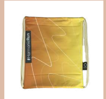
SAC À DOS