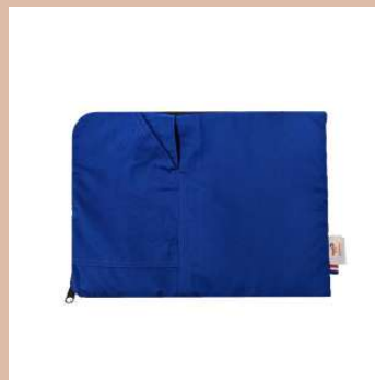
HOUSSE ORDI ZIP